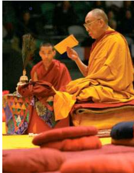
Đức Đạt Lai Lạt Ma giảng dạy về các Giai tầng Thiền định của Ngài Kamalashila

Đây là phước duyên chỉ có một lần trong đời người để học về một pháp tu và thực hành thiền định do chính Đức Đạt Lai Lạt Ma hướng dẫn. Sau năm ngày học, các khóa sinh sẽ hiểu rõ ràng hơn tại sao thiền định đóng vai trò quan trọng trong Phật giáo và trong đời sống tâm linh.