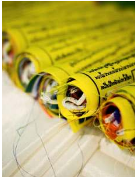
Sách Bhavanakrana (hay Gompai Rimpa) của Ngài Kamalashila viết trên lụa

Trong suốt khóa học Đức Đạt Lai Lạt Ma sẽ giảng cả hai thời sáng và chiều, đặc biệt ngày cuối có Lễ Quán đảnh Quan Thế Âm Bồ tát (Avalokiteshvara or Chenrezig Initiation) vào buổi sáng. Các thời thiền định và các buổi thảo luận sẽ được tổ chức từ sáng sớm đến chiều tối mỗi ngày, để những ai ao ước muốn tu học chương trình năm ngày này được xem như là một lần nhập thất.