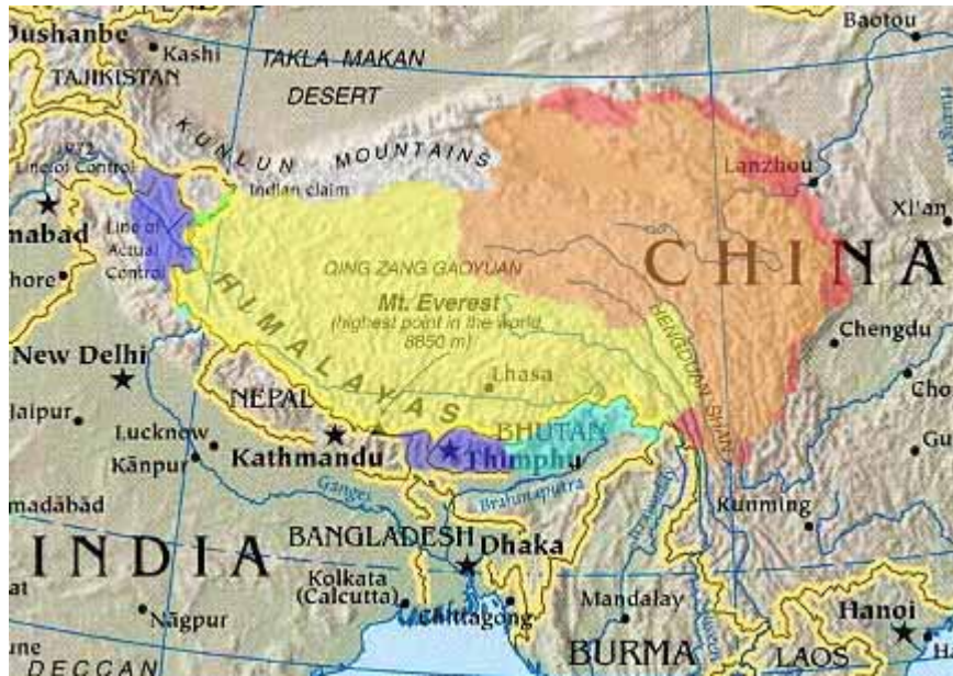
Vùng màu vàng là lãnh thổ của nước Tây Tạng trước đây