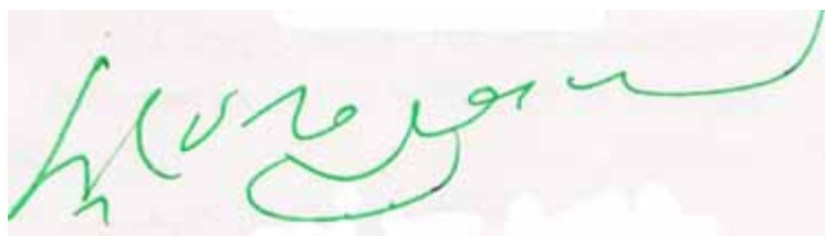
Chữ ký của đức Dalai Lama 14