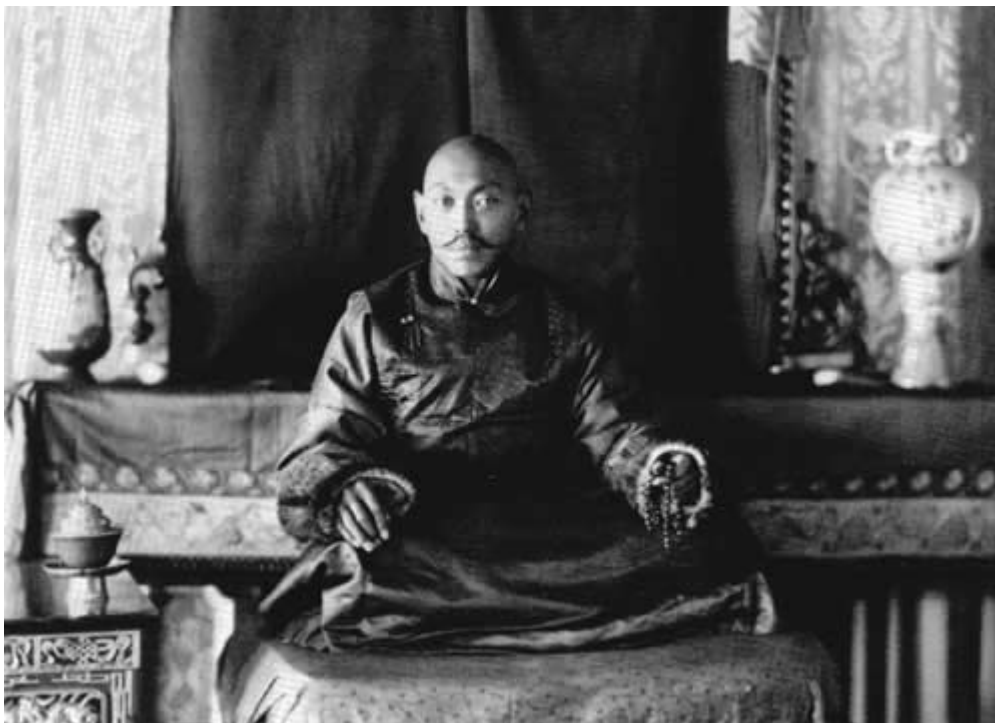
Vị Đạt-lai Lạt-ma thứ 13