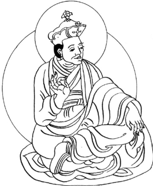
Tranh họa ngài Karma Lingpa thuộc bản quyền của Wisdom Publications Boston

đều rất chú tâm vào việc khai triển những hướng dẫn về Cõi Trung-Giới và giữ cho giòng truyền thừa của Cõi Trung-Giới không bị gián đoạn.