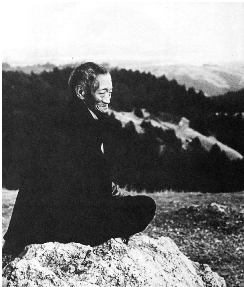
Kalu Rinpoche (1905-1989)

Đối với những người biết tôi và cuộc đời của tôi, ước muốn đi theo con đường dẫn đến giải thoát của Lạt ma (Đạo sư) của họ, tôi xin nói ít lời này.