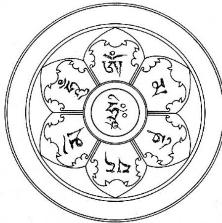
The Six-Syllable Mantra

Ta nên coi Đức Avalokiteshvara (Chenrazi – Quán Thế Âm) là Bổn Tôn của ta. Đức Phật đã giảng dạy thực hành này trong nhiều Kinh điển và tantra (Mật điển). Nó từng là thực hành của nhiều Đạo sư uyên bác và thành tựu của Ấn Độ và Tây Tạng. Thực hành này dễ dàng nhưng vô cùng lợi lạc. Ta nên liên tục trì tụng thần chú Sáu-Âm (Lục Tự Đại Minh), tụng đọc nó với tâm thức rỗng rang, trong trạng thái không ngừng tỉnh giác, thoát khỏi sự quy chiếu, bám chấp và xao lãng.