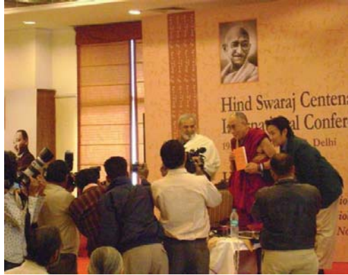
Đức Đạt Lai Lạt Ma phát hành bản dịch Tạng ngữ của cuốn 'Hind Swaraj'

Đức Đạt Lai Lạt Ma cũng được yêu cầu chính thức lãnh đạo Phong trào Gandhi Toàn cầu. Tuy nhiên, nhà lãnh tụ Tây tạng chỉ vào các nhà Gandhian lão thành ngồi ở hàng ghế thính giả và nói: ‘Các ông mới là lãnh tụ, tôi chỉ là một chú tiểu, một môn đệ của Ấn Độ. Các ông mới chính là thầy.’ Sau đó, chấp nhận lời đề nghị, ngài tán dương nỗ lực của các nhà Gandhian và nói: ‘Vâng, vâng, tôi rất, rất hạnh phúc, các ông đang làm một việc rất tốt’.