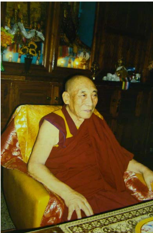
Ngồi trên Ngai Pháp lúc trở về tu viện