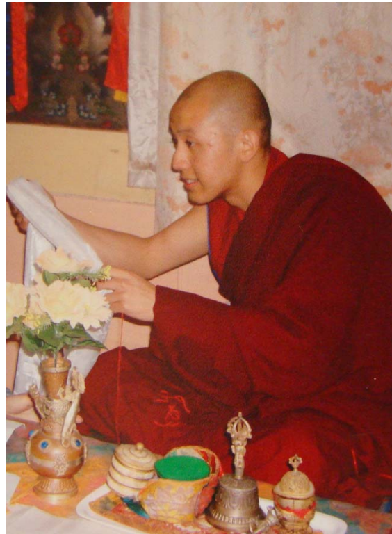
Ngai Kyabje Zong Rinpoche